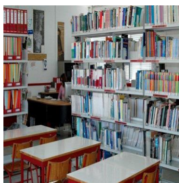
Centro de Recursos